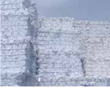
1. HAMUR EKSTRA / 3.05 SWL Sorted White Ledger