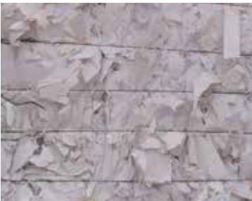
BASKISIZ CTMP / 3.19 CTMP Unprinted Bleached Sulphate Board