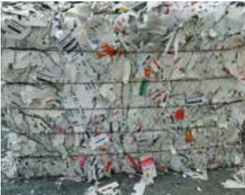
KROMA / 1.03 BBC Boxboard Cuttings