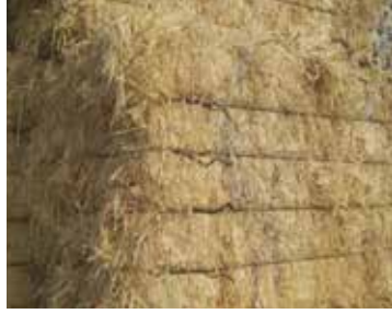
3.HAMUR / 2.07 NOVELCUTTINGS Mechanical Book Shavings