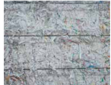
1.HAMUR KIRPINTILARI / 3.03 - 3.04 TWS 3.03. Wood-free Binders / 3.04 Tear White Shavings