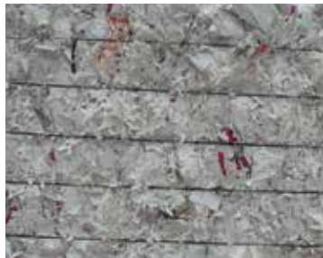
BARDAK KAĞIDI / 5.14 POLYCUP Poly Coated Cup Stock