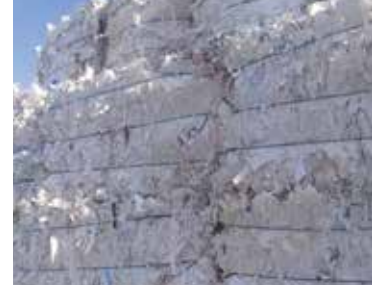
BRISTOL / 3.11 SCANBOARD White Printed Multiply Board