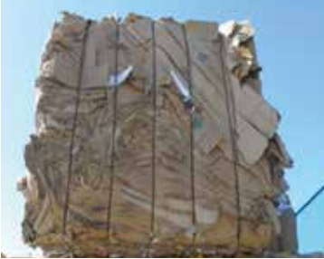
OLUKLU 95/5 / 1.05 OCC 95/5 Corrugated Containers