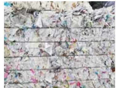
PARÇALANMIŞ KİTAP VE EVRAK / 2.05 SOP Sorted Office Paper