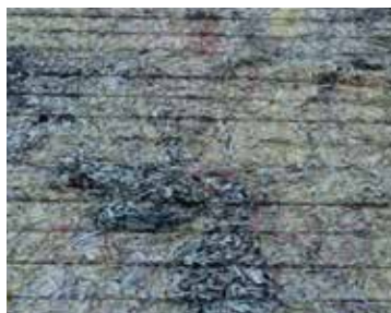
INSERT KIRPINTILARI 2.03 Lightly Printed White Shavings