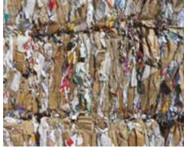
OLUKLU 80/20 / 1.04 OCC 80/20 Ordinary Corrugated Paper and Container