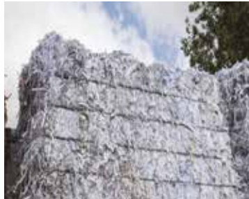
KUŞE KAĞIT / 3.10 CBS Coated Book Stock Multiprintings